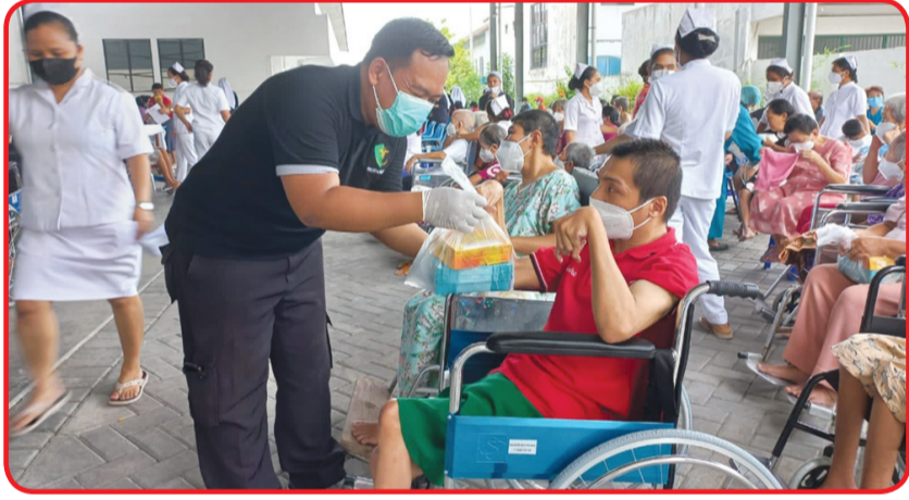
Pemberian makan siang peserta vaksinasi.