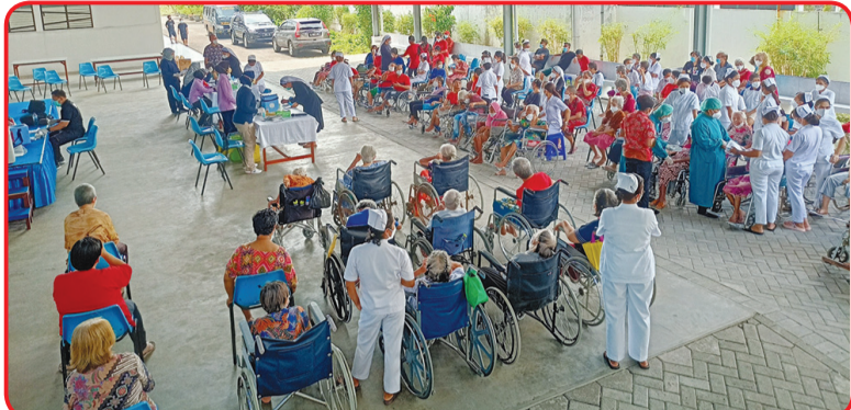
Suasana pelaksanaan vaksinasi.