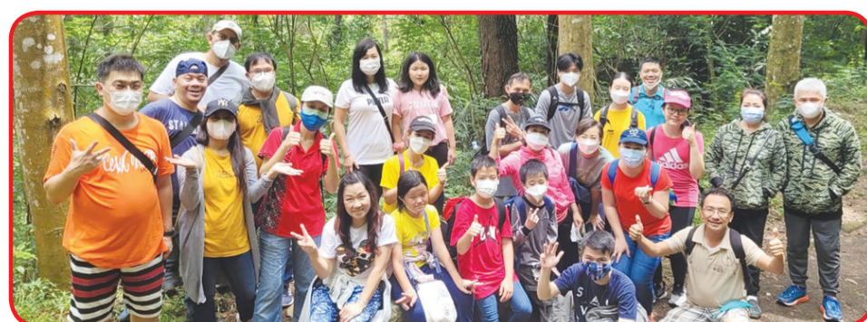
Jemaat Persekutuan Doa Karismatik Katolik PDKK berfoto bersama setelah menikmati senam pagi.