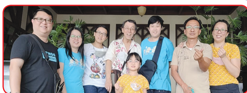
Sebagian jemaat Persekutuan Doa Karismatik Katolik PDKK berfoto bersama.

Setelah Taman Hutan Raya dibuka untuk umum, anggota Persekutuan Doa Karismatik Katolik berunding dan memutuskan pergi ke sana bersama-sama untuk melakukan senam pagi dan aerobik, menghirup udara segar, berjemur di bawah sinar matahari yang hangat serta berjalan-jalan dan mengobrol dengan hati gembira.