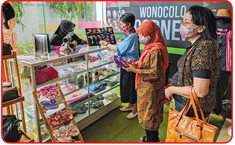
Pengunjung melihat-lihat dan berbelanja produk UMKM kreatif yang dipasarkan di Wonocolo Corner.

"Kami ingin produk UMKM kreatif yang ditampilkan, mampu menarik minat wisatawan. Ini adalah sinergitas antara pemerintah dan swasta, dalam membangkitkan perekonomian masyarakat dimasa pandemi Level 1," ujar istri Walikota Surabaya tersebut. Saat ini, Wonocolo Corner menampung 10 pelaku industri kreatif UMKM non F&B, untuk memasarkan produk fashion dan aksesoris. • anto tse