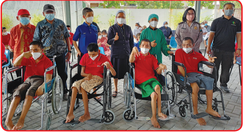
Bersama anak berkebutuhan khusus penghuni panti Bhakti Luhur.