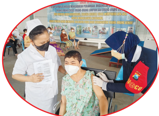
Pemberian suntikan vaksin kepada lansia.