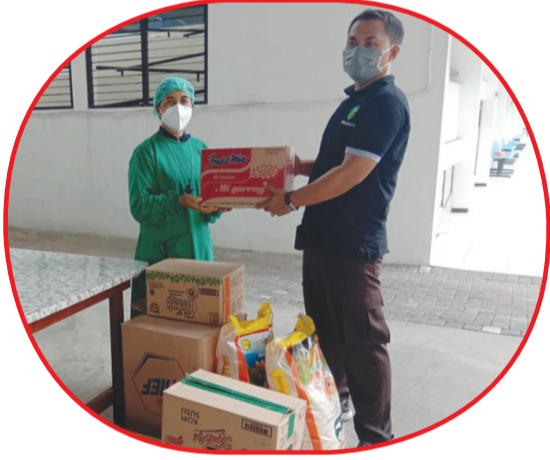
Kepala Panti Suster Christina menerima bantuan sembako.