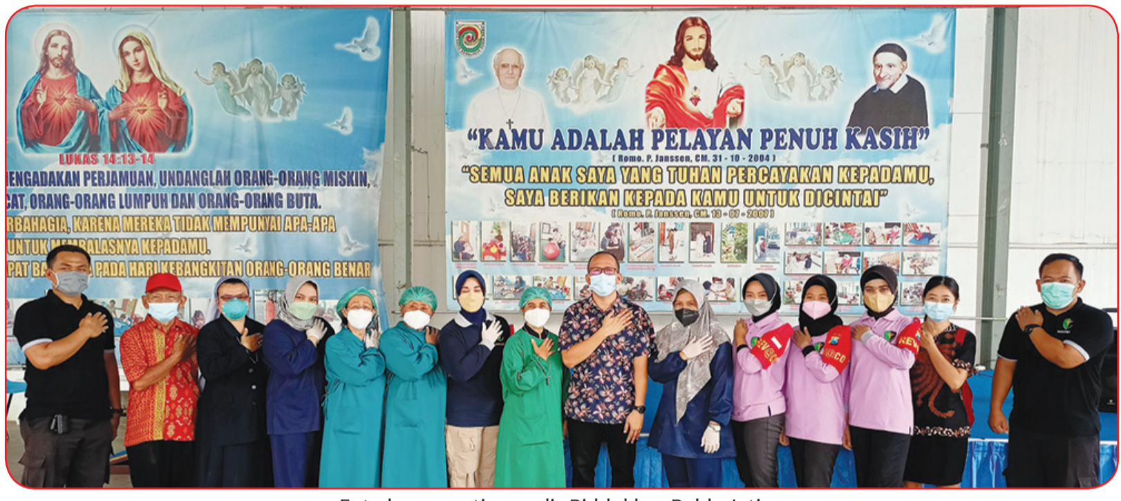
Foto bersama tim medis Biddokkes Polda Jatim.