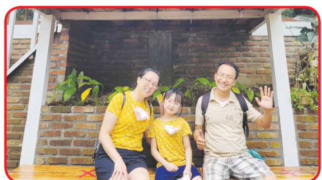
Beristirahat sejenak sebelum melanjutkan perjalanan.

Kali ini kelompok Persekutuan Doa Karismatik Katolik PDKK mengadakan kegiatan senam pagi bersama di Taman Hutan Raya. Hal ini membuat semuanya menjadi gembira melewati liburan yang indah dan sehat. • idn/din