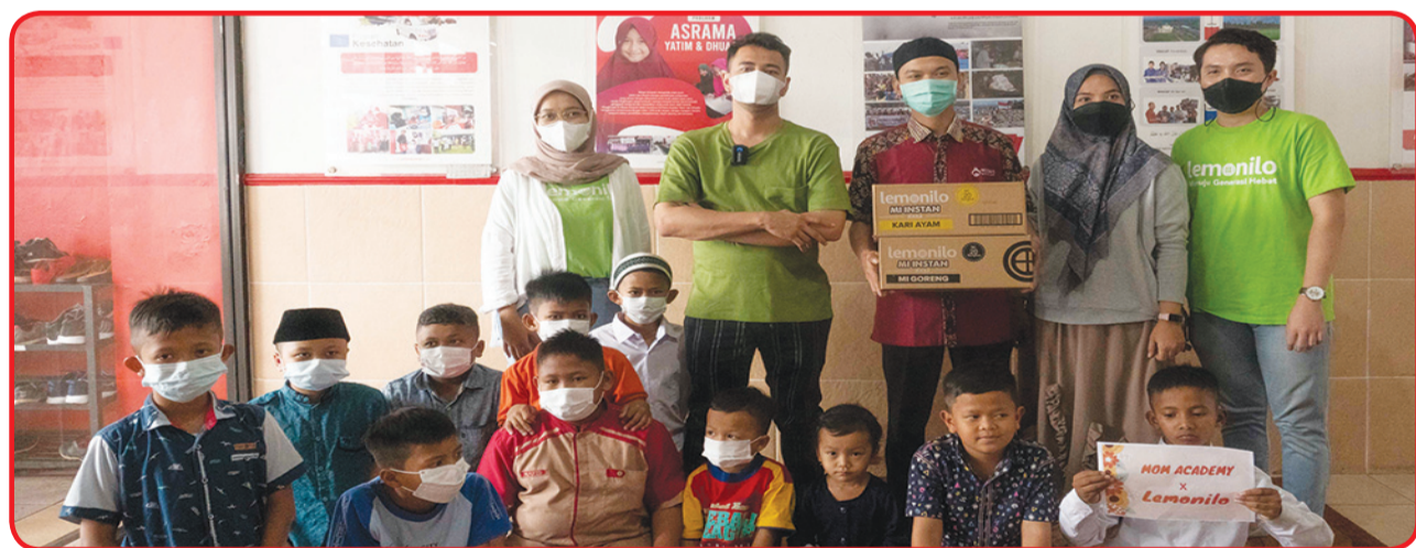
Raffi Ahmad dan tim Lemonilo berfoto bersama anak-anak panti asuhan.