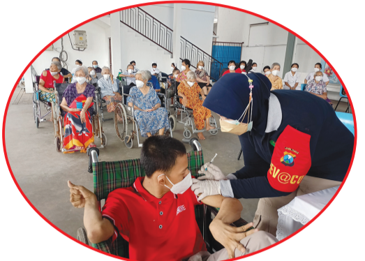
Pemberian suntikan vaksin kepada anak berkebutuhan khusus.

SURABAYA (IM) - Biddokkes (Bidang Kedokteran dan Kesehatan) Polda Jatim melaksanakan vaksinasi penghuni Panti Asuhan dan Panti Jompo Bhakti Luhur, Sidoarjo, pada 29 Oktober 2021.