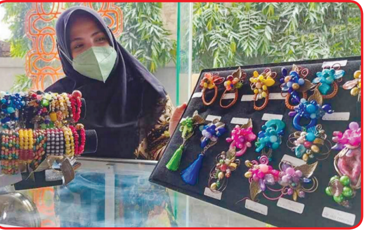
Pelaku UMKM Wonocolo memamerkan produk fashion dan aksesoris di Wonocolo Corner.