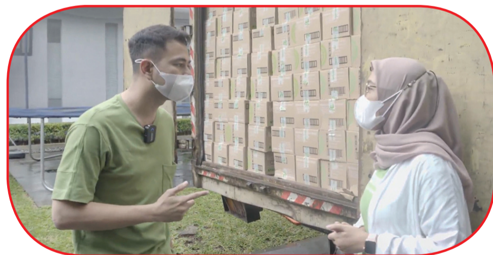
Raffi Ahmad berbincang dengan salah satu tim Lemonilo.